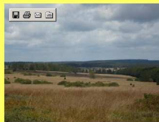
Est de la Fagne Wallonne (Haie de Souk en arrière plan) fin août 2007...et début septembre 2007