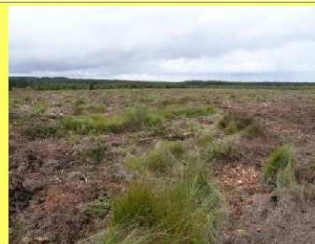
Le Geitzbusch forestier (cant. Verviers) début août 2007...et fin août 2007